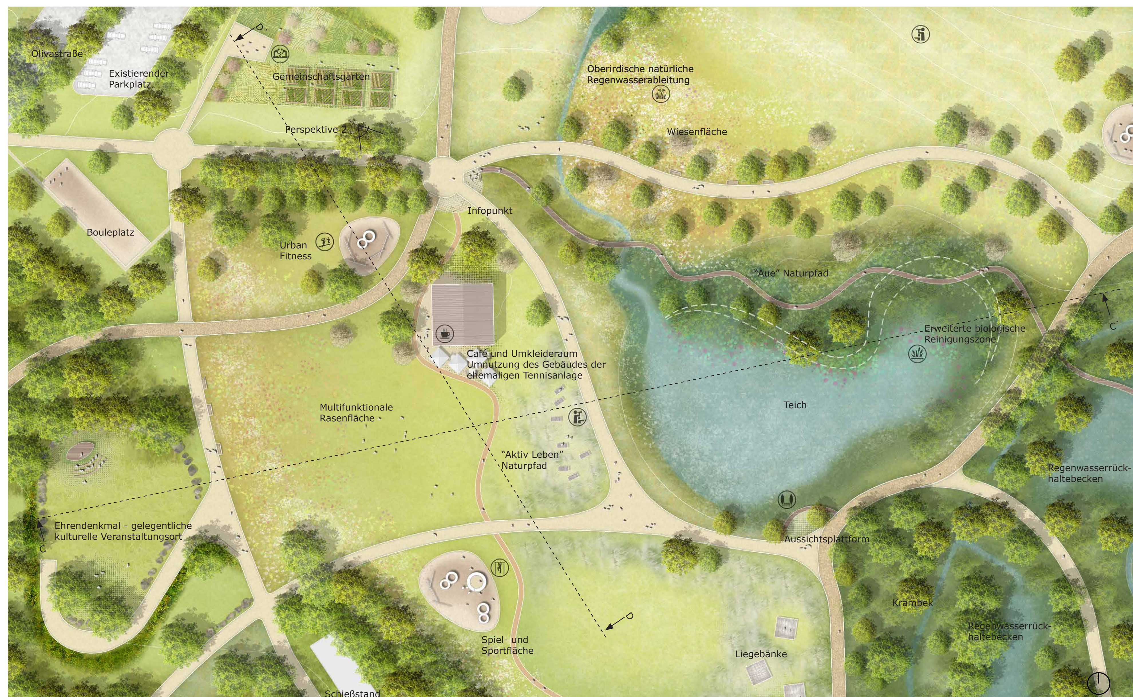
UMGEBUNG DES BÜRGERHAUSES 1:500