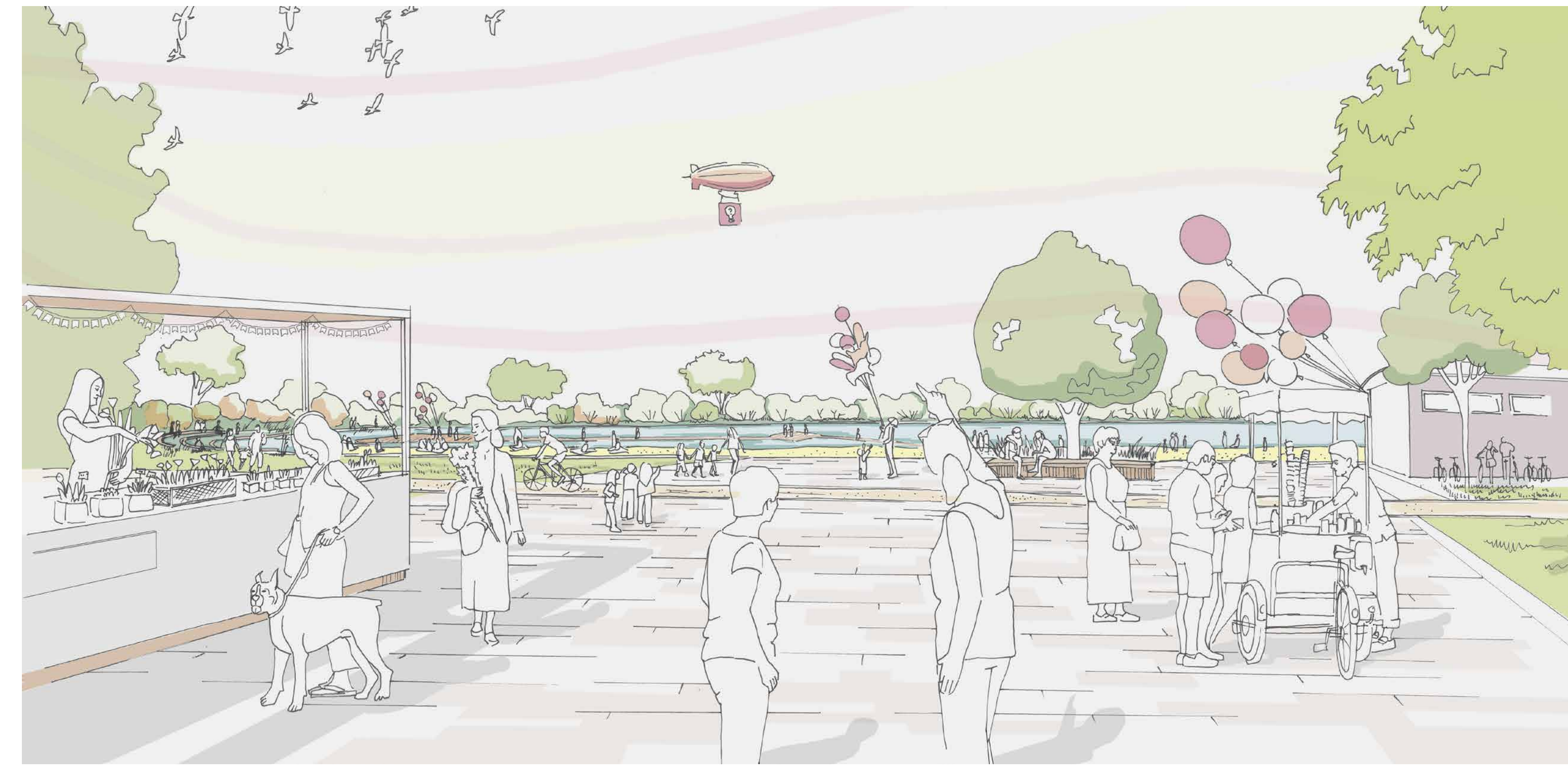
PERSPEKTIVE ÜBER DEN BÜRGERPLATZ ZUM SEE