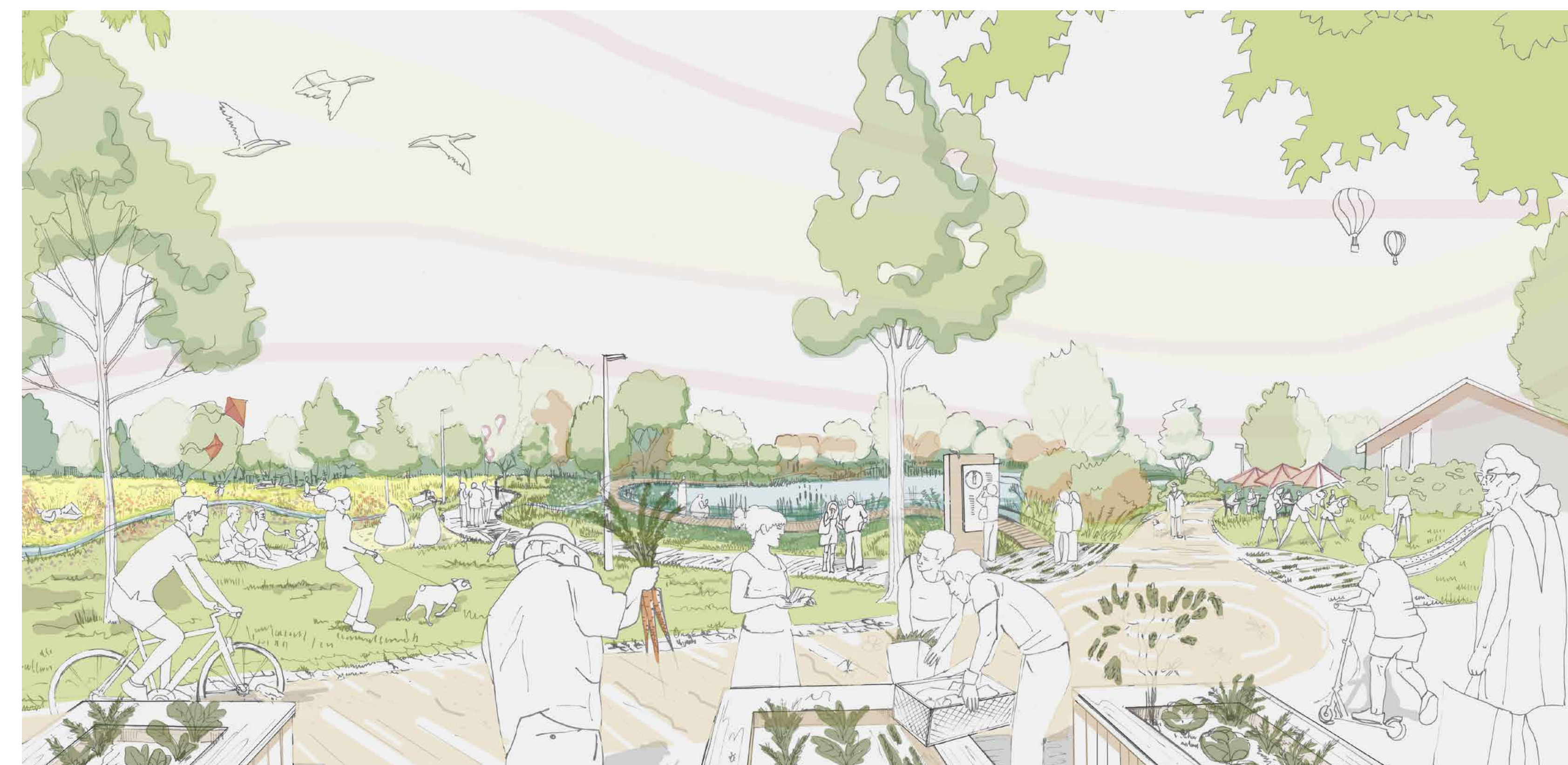
PERPEKTIVE VOM GEMEINSCHAFTSGARTEN ÜBER DEN SEE