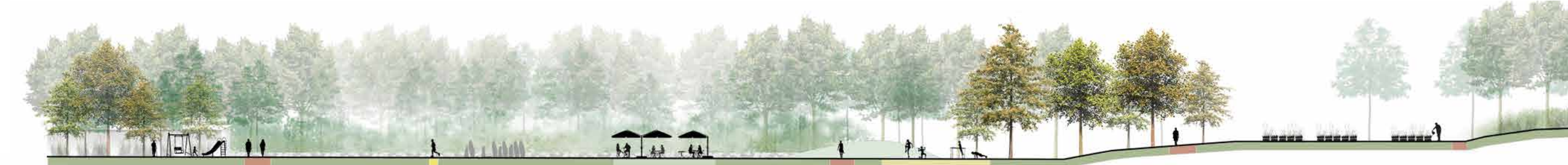
SCHNITT D-D', M 1:500

Das nahe gelegene Café und der Blick über den See verstärkt die Aufenthaltsqualität und den Wohlfühlaspekt.