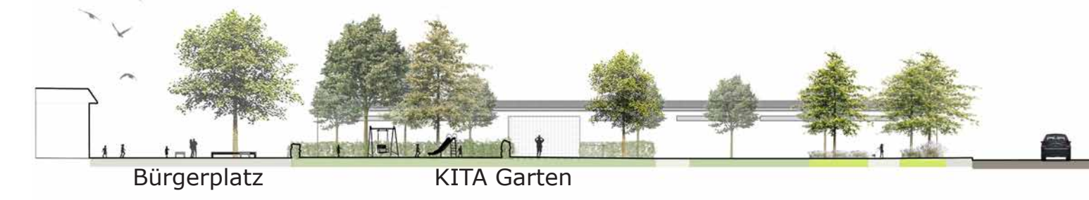
SCHNITT B-B', M 1:500